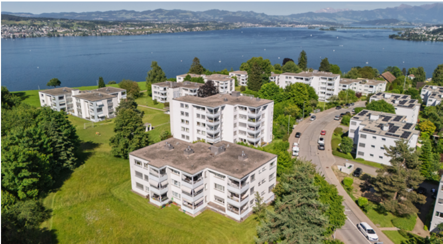
Wohnüberbauung der GVZ, Richterswil; Foto: zVg Jones Lang LaSalle AG

In Umfragen geben die Kundinnen und Kunden der GVZ regelmässig sehr gute Bewertungen. Das ist unser Antrieb, uns kontinuierlich weiterzuentwickeln. Wir nutzen die Möglichkeiten der Digitalisierung, machen Kundeninformationen orts- und zeitunabhängig rasch verfügbar und steigern damit die Beratungsqualität und -effizienz markant. Dabei haben Datenverlässlichkeit, Datenschutz und Rechtssicherheit oberste Priorität.