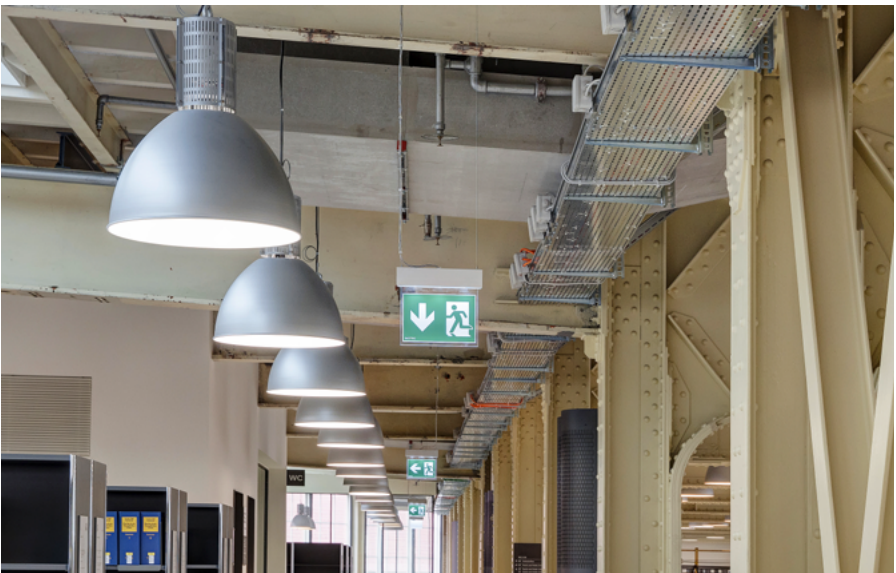
ZHAW Hochschulbibliothek, Winterthur; Foto: Roger Stirnimann, GVZ

Als beaufsichtigende Instanz für den Brandschutz im Kanton hat die GVZ einen Bildungsauftrag: Sie bietet Ausbildungen und Weiterbildungen in Form von einzelnen Modulen für die kommunalen Brandschutzbeauftragten an und führt im Rahmen eines breit gefächerten Angebots für alle im Brandschutz engagierten Personen weitere Schulungen, Praxiskurse und Workshops durch. Neben den Kommunalen Brandschutzbeauftragten und den Sicherheitsbeauftragten Brandschutz sind Planerinnen und Planer, Architektinnen und Architekten sowie Bauschaffende als wichtige Anspruchsgruppe dabei. In enger Zusammenarbeit mit ihnen gelingt es, die Anforderungen des Brandschutzes umfassend wahrzunehmen.