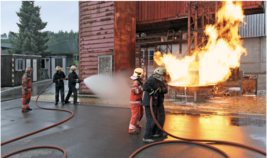
Ausbildungszentrum Andelfingen AZA; Foto: Christoph Keller, GVZ