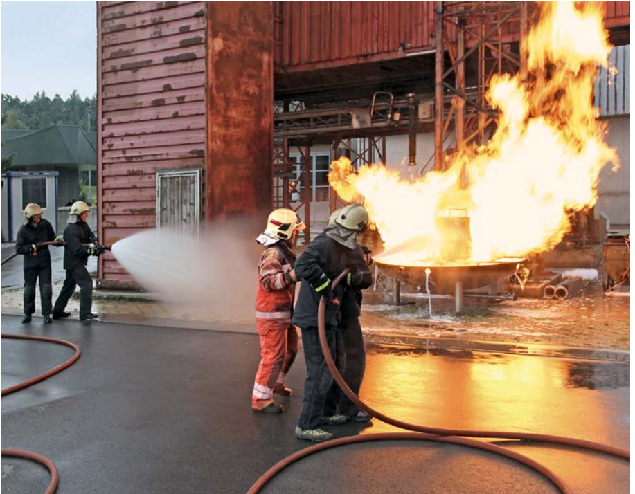
Ausbildungszentrum Andelfingen AZA