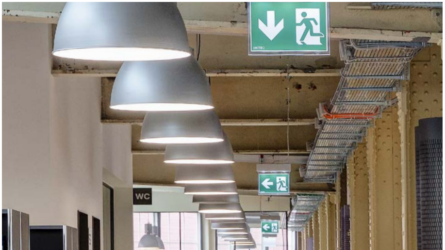
ZHAW Hochschulbibliothek, Winterthur; Foto: Roger Stirnimann, GVZ

Kompetenzen, um sowohl die Bauherrinnen und Bauherren als auch die Eigentümerschaften sowie die Bewirtschafterinnen und Bewirtschafter fachgerecht zu beraten und die Wirksamkeit von Brandschutzmassnahmen je nach Gebäudeart zu kontrollieren.