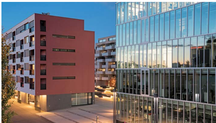
Wohnüberbauung der GVZ, Schlieren

Gebäudeschäden durch Naturgefahren nehmen zu. Die beste Versicherung dagegen ist Prävention. Deshalb helfen wir unseren Kundinnen und Kunden, ihr Eigentum vor Schäden durch Hagel, Starkregen und Sturm wirksam zu schützen. Unser Expertenteam für Naturgefahren berät sie bei der Wahl geeigneter Objektschutzmassnahmen.